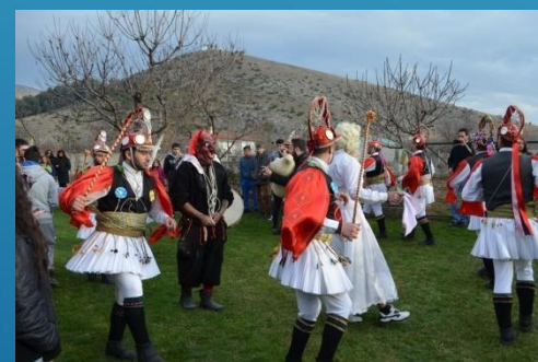
Μωμοέρια. Ένα έθιμο του Δωδεκαημέρου