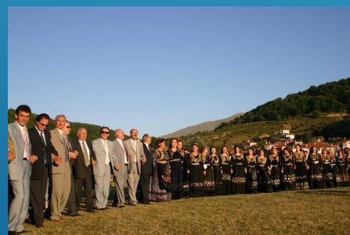
Τρανός Χορός στη Βλάστη Κοζάνης